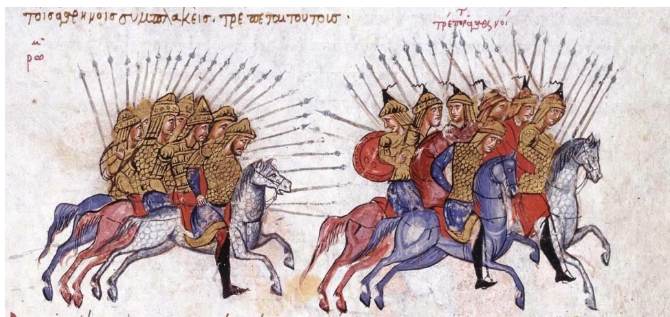
Το βυζαντινό ιππικό καταδιώκει Άραβες κατά τη διάρκεια της μάχης, μικρογραφία από κώδικα που περιέχει την Ιστορία του Ιωάννη Σκυλίτζη, 13 ος αιώνας, Εθνική Βιβλιοθήκη Ισπανίας, Μαδρίτης